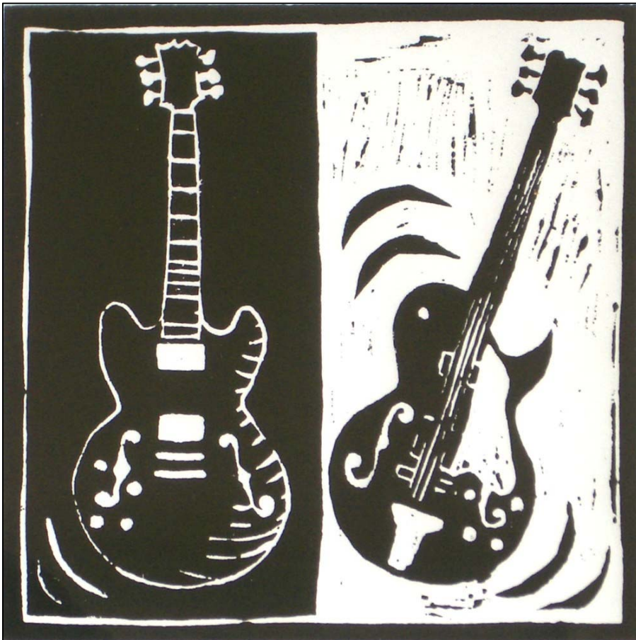
Bildlärare på Anders-Olof skolan.